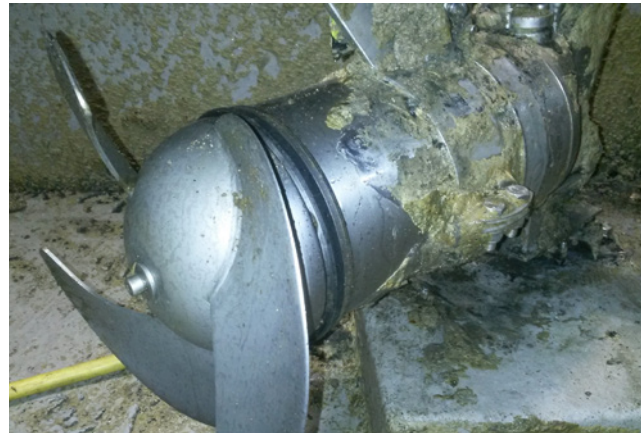
Vue de l'agitateur sur son kit pour inspection après 6 mois de fonctionnement