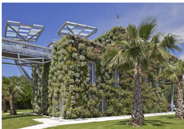
Aquaviva, une station d'épuration innovante qui répond aux exigences du Grenelle de l'environnement